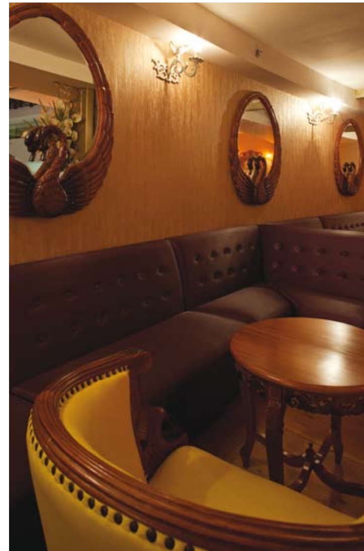
שלל דימויים של תרבויות בעולם כאשר רצפת הבטון הטורקיזית, בתוכה חוטבנים ענפים ועלים מליון, מהווה אלמנט מקשר בין כולם. למעלה: פינת הארט-נובו. בעמוד מתול, למטה: פינת ורסאיי, חפצו פלטי ועל חפצו ורסאיי ורסאיי היקודים. בעמוד מתול, למעלה: הקפה היוגאי.

גם במעגלים השליטה נתונה למנהלי האירוע והיא מתבצעת באותם כלים. בעזרת הכוונה מדויקת של מבט אל מרכז הזירה ולהיקפה, בעזרת תנועה רדיאלית אל תוך החלל המרכזי ובעזרת הצבע והתאורה – מנוהלת אירוע, המנתק את האורחים מהעולם החיצוני. פגעי מזג האוויר והסביבה הפיזית מעבר לחלל הפנים – זניחים לחלוטין. האורחים הרי מצויים בעולם הבלתי אפשרי של "מעגלים", בו ניתן לשבת שתי דקות בפריס ומיד אחר-כך לעבור להודו. גם ביטול הישיבה הפורמאלית תומכת בביטול תחושת הזמן: לא מרגישים כמה מנות נאכלו, לא מרגישים את משך הישיבה. האורחים שותפים פעילים לאלשיה. בניגוד למלונות לאס וגאס בהם לרוב ישנו נושא ברור, החלל שלפנינו מנסה להיות הכל. האקלקטיות שלו דומה במידה לא מבוטלת לאתרים דוגמת דיסני-וורלד. אתרים, בהם הרעיון הוא לבלות, ליהנות ולשכוח מהמציאות תוך כניסה למגוון עולמות באתר עצמו. ב"מעגלים" מתקיים מעין "מסע מסביב לעולם ב-80 דקות". במידה רבה המעבר מפינת הסבה אחת לרעותה דומה לזפזוף בטלוויזיה: קפיצות מהירות ושטחיות, ללא התחייבות לדייק או להפשטה עמוקה.